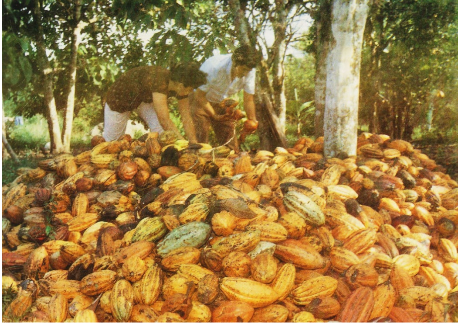
El tradicional cacao de calidad del Alto Huallaga y Ucayali